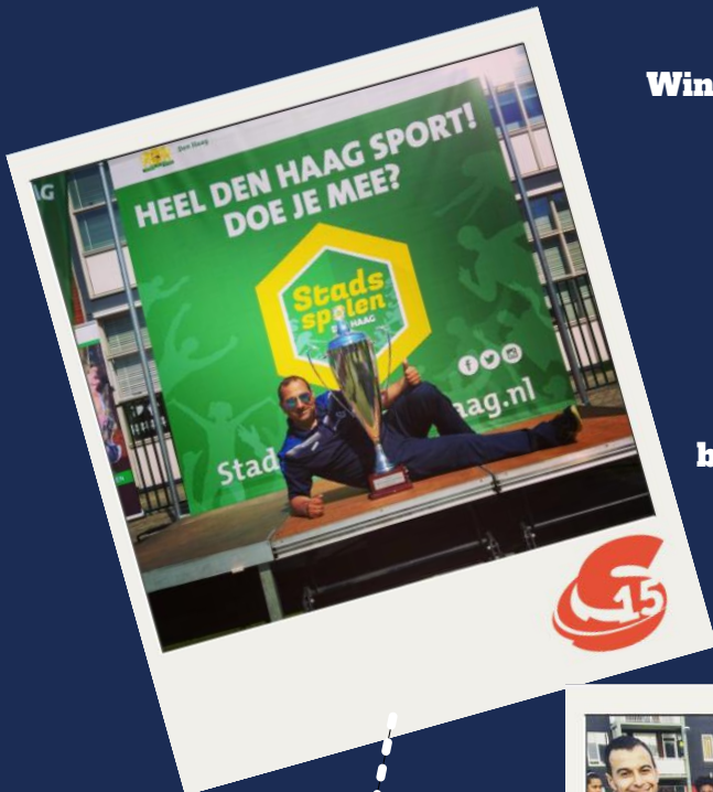
Bezoek v/d burgemeester (2018)