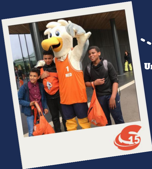
Urban Volley Finale (2018)