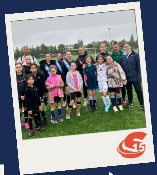
Voetbalclinics voor meiden (2024)