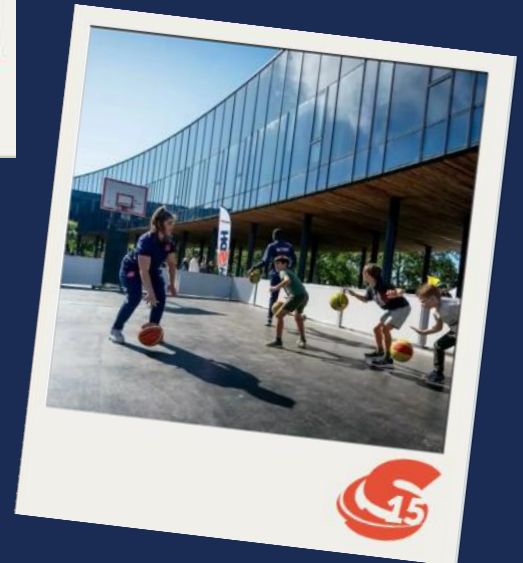
Basketbal bij Sportcampus (2024)