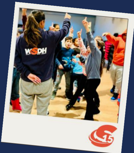
Dansworkshop kerstvakantie (2023)