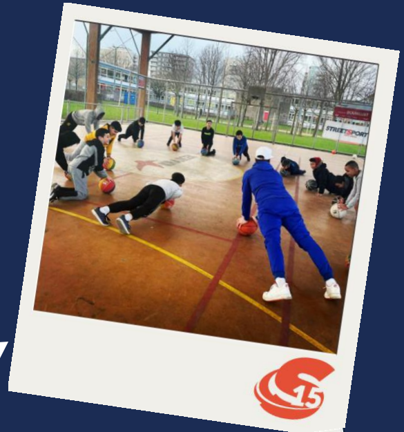
Streetsport Wintergames (2021)