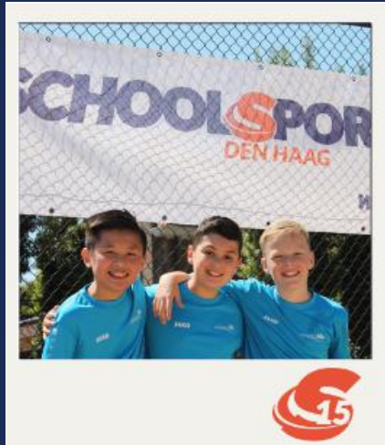
Sport Experience (2024)