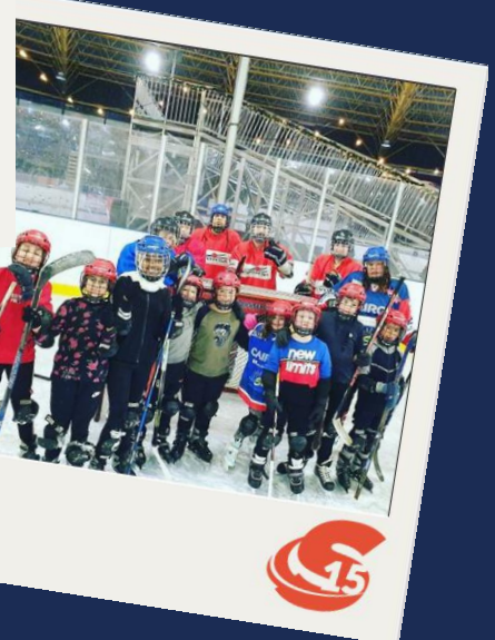
Kampioenen Cruyff Courts 6v6 (2016)